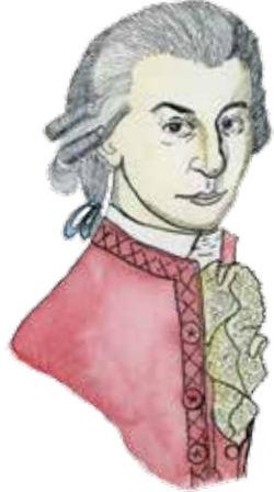
العصر الكلاسيكي (1750 - 1820)

استغرق الأمر حوالي أربعة قرون حتى تطورت الأوركسترا من حيث الشكل والحجم والصوت إلى ما هي عليه الآن.