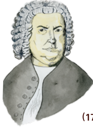
عصر الباروك (1600 - 1750)

زاد حجم الأوركسترا في هذه الفترة من 50 إلى 60 عازف، حيث تضاعفت أعداد الآلات الوترية وآلات النفخ الخشبية. وقد تغير صوت الأوركسترا بحيث تنوع النغمات بشكل كبير، مما ساعد على وجود إمكانية لانخفاض وارتفاع الأصوات بصورة تختلف عما قبل.